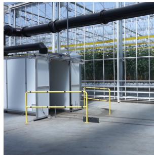
Cart Disinfection Station