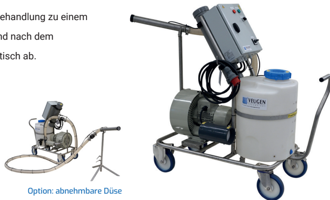
Option: abnehmbare Düse

Der Powerfog P60 ist jetzt auch mit abnehmbarem Sprühkopf (kann auch auf den Ständer gestellt werden) und mit verlängertem Schlauch erhältlich. Dies macht das Gerät noch einfacher außerhalb des zu behandelnden Bereichs zu positionieren.