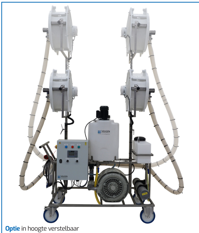
Optie in hoogte verstelbaar